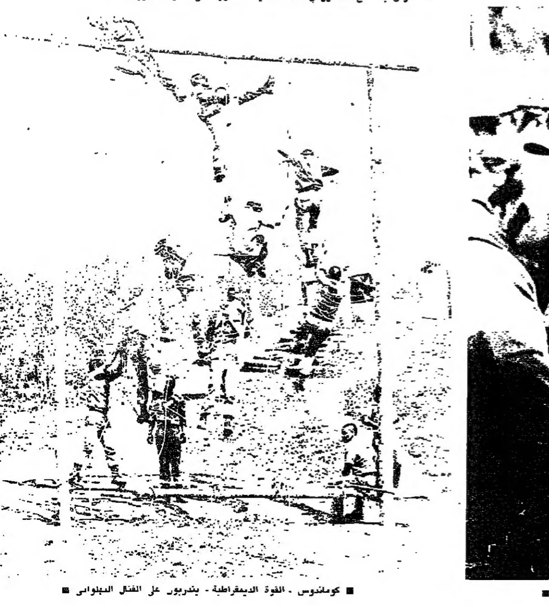
كوماندوس - القوة الديمقراطية - يتدربون على القتال البيروسي

اعلن مصدر رسمي في برازيليا ان الرئيس خوسيه سارني رفض امس استقالة الحكومة البرازيلية التي شكلها سلفه الرئيس تالكريديو نيفيس قبل وفاته. وكان الهدف من استقالة الحكومة التي قدمها فرناندو ليرا وزير العدل باسم جميع اعضاءها هو السماح للرئيس الجديد باختيار اعضاء حكومته بعد تيفيس.